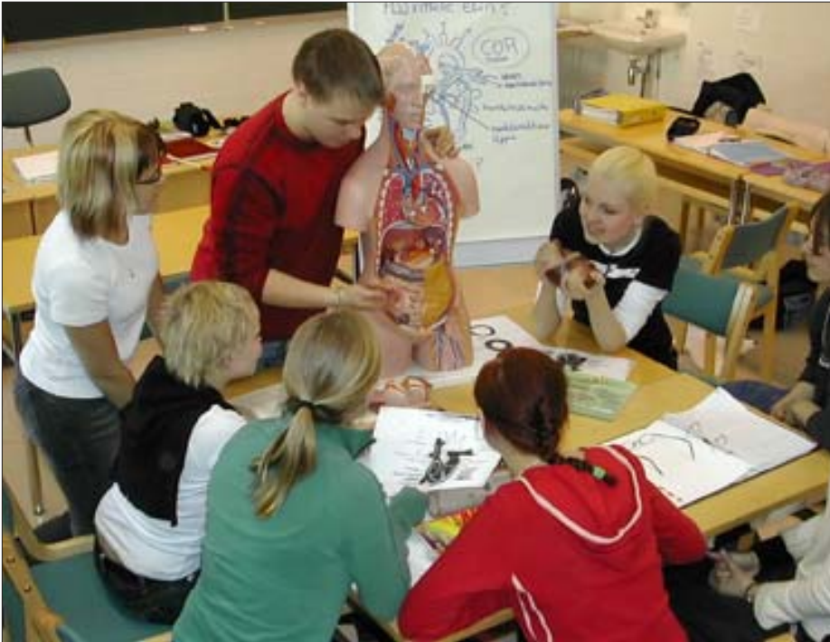
Lehtiniemessä syksyllä 2004 aloittaneet lähihoitajat yhteistoiminnallisesti oppimassa.