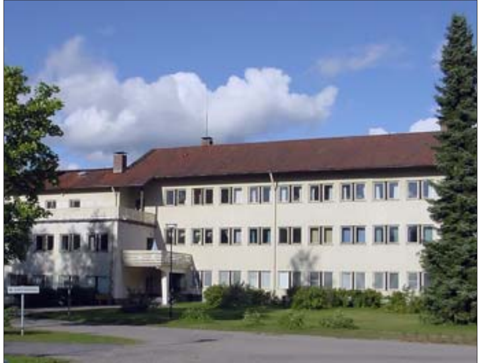
Sisälähetysseuran oppilaitos Pieksämäellä.